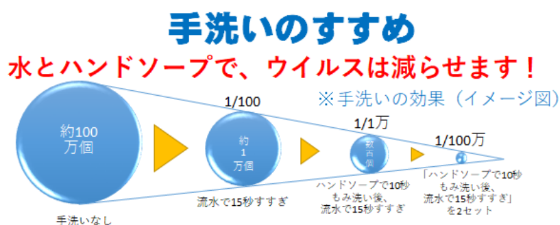
図 1. 手洗いのすすめ

まずは 3 つの蜜、密閉空間（換気の悪い密閉空間である）、密集場所（多くの人が密集している）、密接場面（互いに手を伸ばしたら届く距離での会話や共同行為が行われる）のいずれか 1 つの条件をも避けることが重要で、さらに「身体的距離の確保」、「マスクの着用（咳エチケットの励行）」及び「手洗いなどの手指衛生（石けんによる手洗いや手指消毒用アルコールによる消毒）」（図 1）をはじめとした基本的感染症対策を継続する必要がある。手や指についたウイルスは流水による 15 秒の手洗いだけで 1/100 に、石けんやハンドソープでもみ洗いし、流水で 15 秒すすぐと 1 万分の 1 に減らせる。ワクチン接種が進んでも、このような徹底的な衛生管理を含めた「新しい生活様式」の実践によって、感染拡大を予防していくことが重要となる（図 2）。